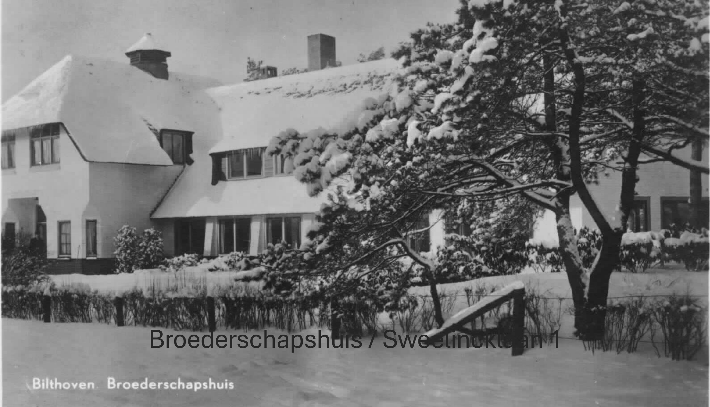
Broederschapshuis / Sweelincklaan 1